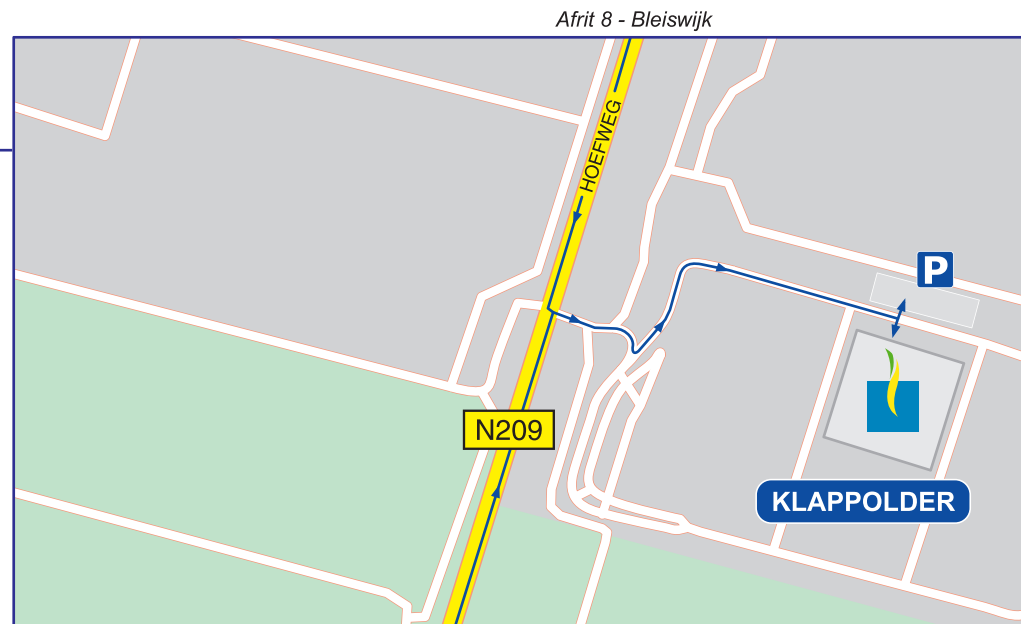
A13 afrit 11 - Berkel en Rodenrijs